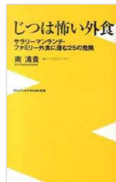
『じつは怖い外食』 南 清貴／著 ワニ・プラス (498.5 ミ)