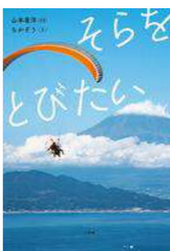
『そらをとびたい』 山本 直洋／写真 ちかぞう／文 小学館 (EK ヤ)