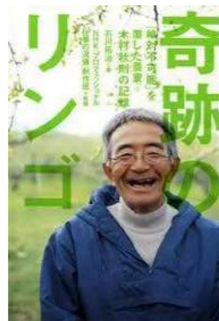
『奇跡のリンゴ』 石川 拓治／著 NHK「プロフェッショナル 仕事の流儀」制作班／監修 幻冬舎 (625.2 イ)