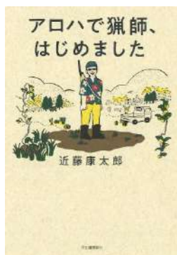
『アロハで猟師、はじめました』 近藤 康太郎／著 河出書房新社 (659 コ)