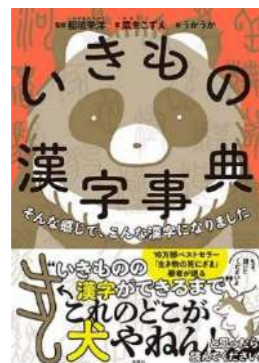
『いきもの漢字事典』 粟生 こずえ／著 稲垣 栄洋／監修 うかうか／絵 文響社 (J811 ア)