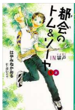
『都会のトム&ソーヤ 5 上』 はやみね かおる／著 講談社 (JF 八 5-1)