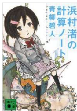
『浜村渚の計算ノート [1さつめ]』 青柳 碧人／著 講談社 (B913.6 ア1)