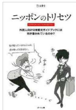
『ニッポンのトリセツ』 ゴ―シュ／編 立東舎 (361.5 二)