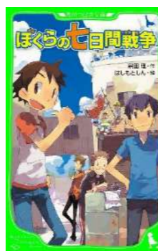
『ぼくらの七日間戦争』 宗田 理／作 はしもと しん／絵 角川書店 (JM ソ)