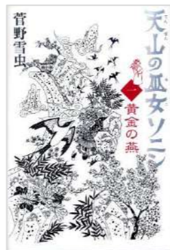
『天山の巫女ソニン 1』 菅野 雪虫／作 講談社 (JF ス1)