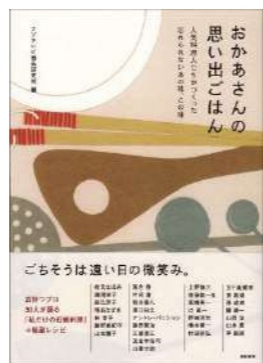
『おかあさんの思い出ごはん』 フジテレビ商品研究所／編 亜紀書房 (596 オ)