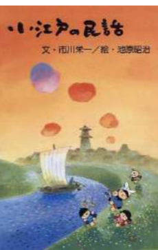
『小江戸の民話』 市川 栄一／著 池原 昭治／絵 さきたま出版会 (388.1 イ)