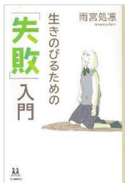
『生きのびるための「失敗」入門』 雨宮 処凛／著 河出書房新社 (J159 ア)