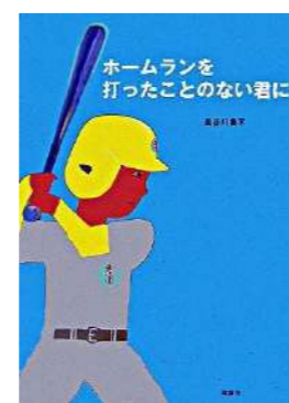
『ホームランを打ったことのない君に』 長谷川 集平／作 理論社 (EE 八)