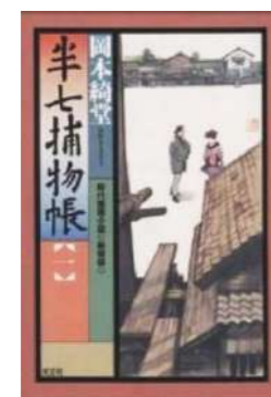
『半七捕物帳 1 新装版』 岡本 綺堂／著 光文社 (B913.6 オ1)