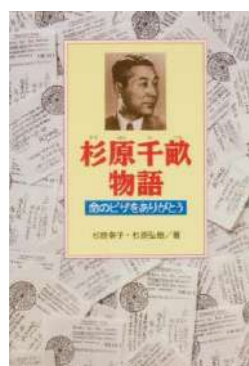
『杉原千畝物語』 杉原 幸子／著 杉原 弘樹／著 金の星社 (J289 ス)