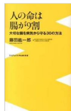
『人の命は腸が9割』 藤田 紘一郎／著 ワニ・プラス (493.4 フ)